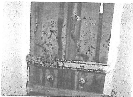
Itt még egyik kötés sincs kicserélve.

b.) Van lehetőség esetleg kevesebb megtakarításra, a kalkulációink szerint mindenféleképpen szükség lenne a nagyobb problémák megoldására 136,800 millió forint megtakarításra, ezzel lakásonként az egy lakásra jutó megtakarítás összege 143.100,-Ft/lakás , ezt lehet egyösszegben befizetni, vagy 18 hónapig 7.950,-Ft/hó kell fizetni 2022. április 1-től a közös költség felújítási alapra (11703006-20001058 bankszámlára).