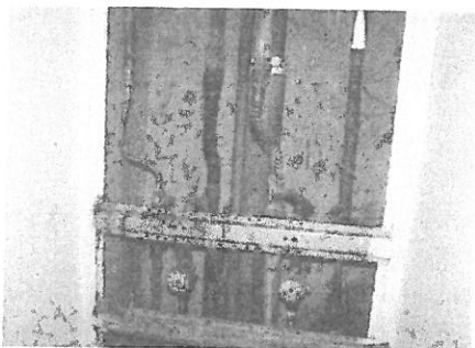
Itt még egyik kötés sincs kicserélve.

b.) Van lehetőség esetleg kevesebb megtakarításra, a kalkulációink szerint mindenféleképpen szükség lenne a nagyobb problémák megoldására 136,800 millió forint megtakarításra, ezzel lakásonként az egy lakásra jutó megtakarítás összege 143.100,-Ft/lakás , ezt lehet egyösszegben befizetni, vagy 18 hónapig 7.950,-Ft/hó kell fizetni 2022. április 1-től a közös költség felújítási alapra (11703006-20001058 bankszámlára).