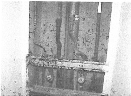
Itt még egyik kötés sincs kicserélve.

b.) Van lehetőség esetleg kevesebb megtakarításra, a kalkulációink szerint mindenféleképpen szükség lenne a nagyobb problémák megoldására 136,800 millió forint megtakarításra, ezzel lakásonként az egy lakásra jutó megtakarítás összege 143.100,-Ft/lakás , ezt lehet egyösszegben befizetni, vagy 18 hónapig 7.950,-Ft/hó kell fizetni 2022. április 1-től a közös költség felújítási alapra (11703006-20001058 bankszámlára).